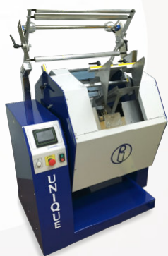
UNIQUE BF EV