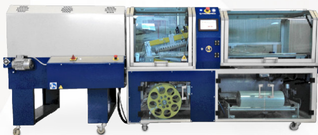
MECPACK FIVE STARS STA