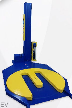
ECOSPIR TS EV