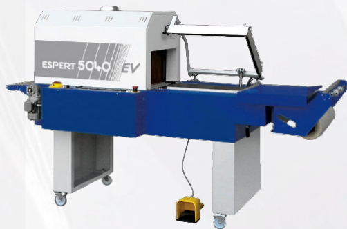
ESPERT 5040 EV