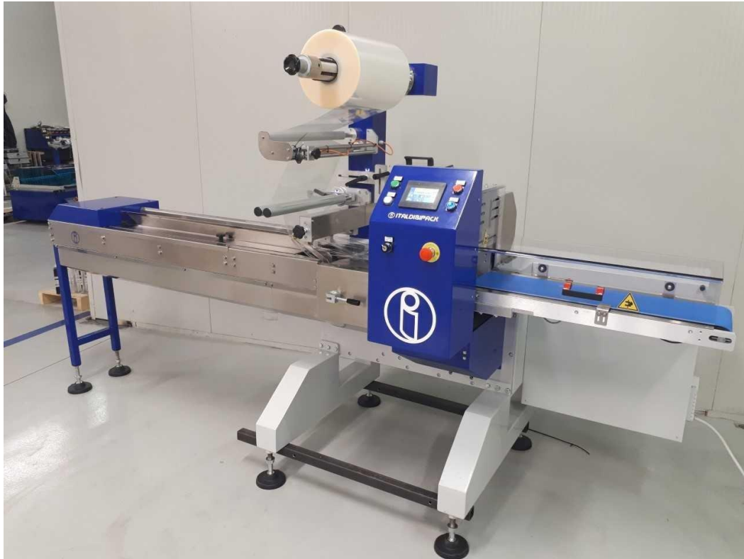
Foto Dibiflow 500